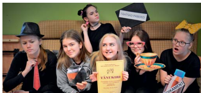
Näitering „Ooteruumiga“ Rõngus