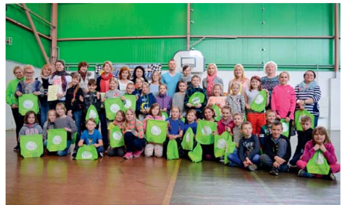
Tervist edendavate koolide kohtumine Ülenurmel